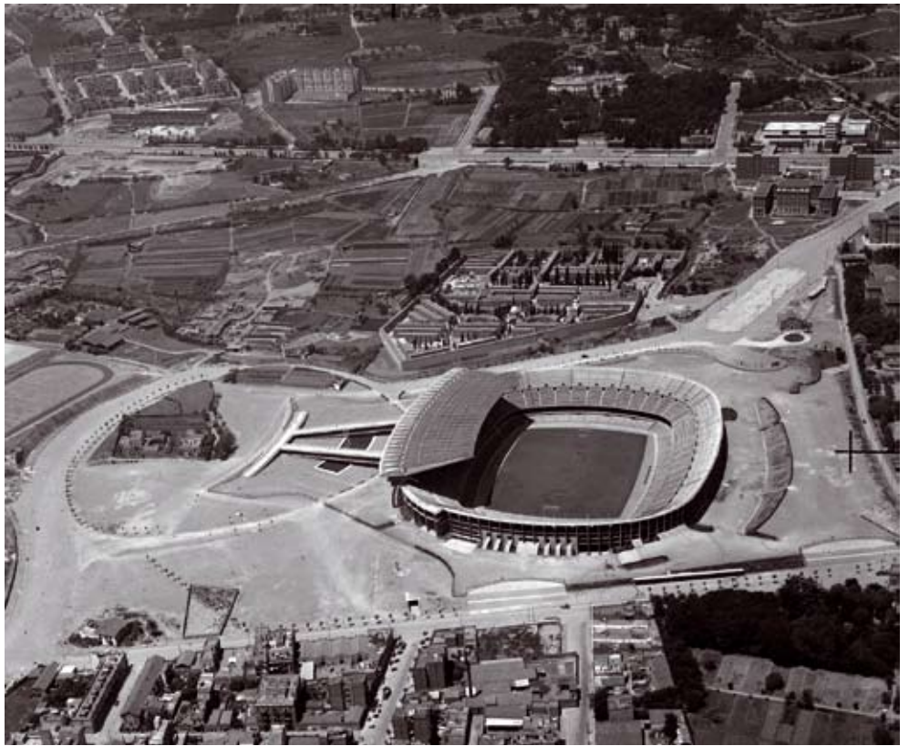
ARXIU NACIONAL FONSTAE HELICOPTERS SA

estadi equilibrat de perfil pla, amb una forta presència de l'estructura que suporta la graderia i amb un únic element de remat, la marquesina que vola sobre la tribuna principal.