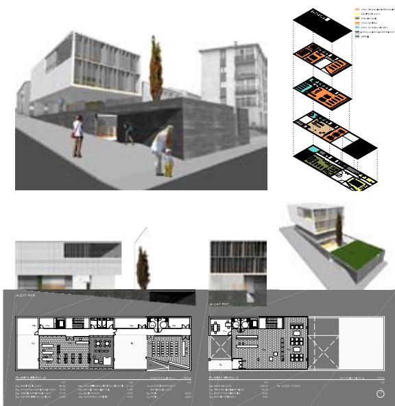
1 Concurs obert per a la Biblioteca Pública d'Hostalric (la Selva) 114 presentats, 3 A1. Guanyadors: Abad, Altàbàs, Àlvaro, Raventós Arquitectes SCP.